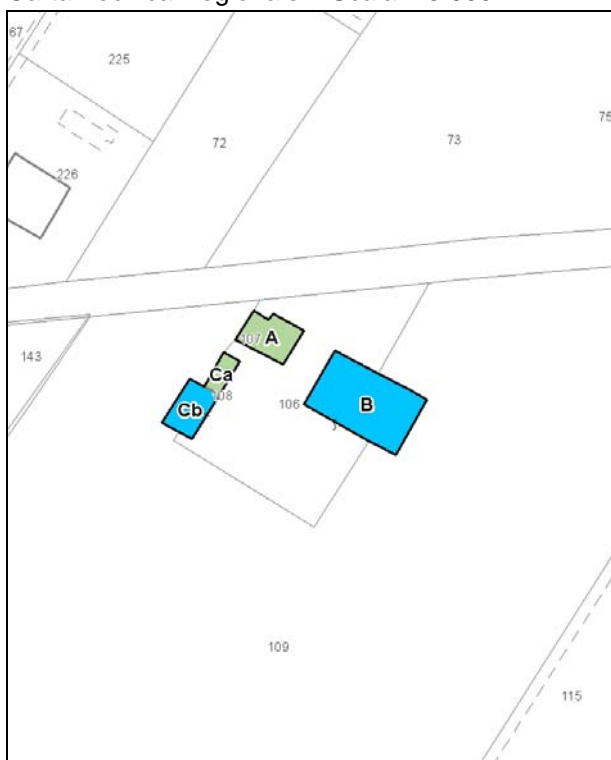
Catasto attuale – Scala 1: 2.000

Dati catastali: Foglio 49; Particelle 106, 107, 108, 109