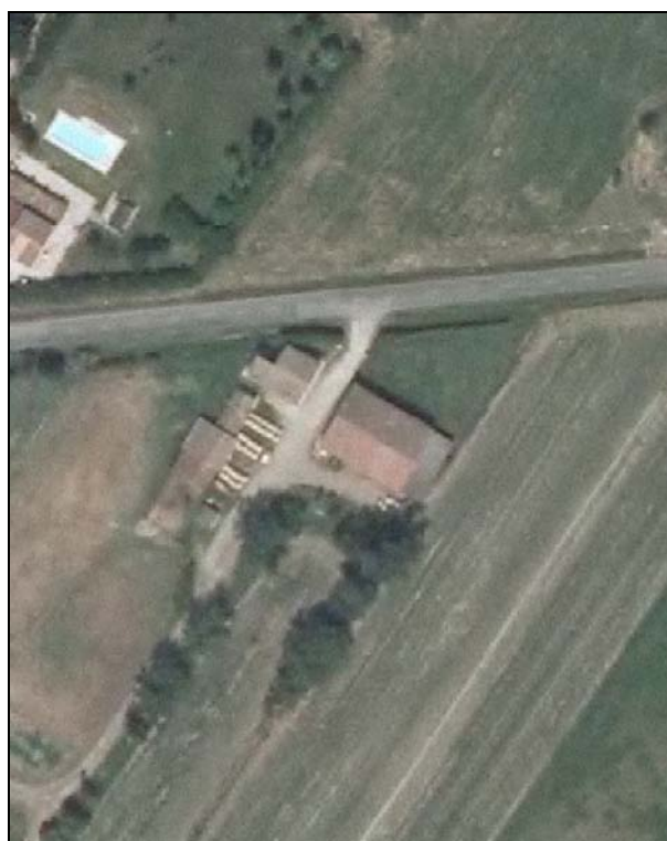
Ortofoto AIMA 2011 – Scala 1:2.000

Presenza di edifici con schede Aedes E: si