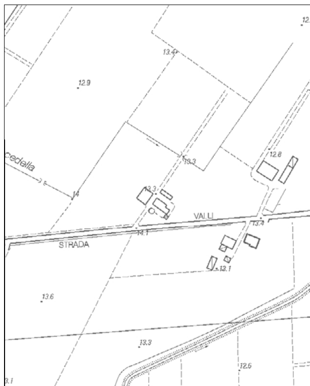
Carta Tecnica Regionale – Scala 1:5.000