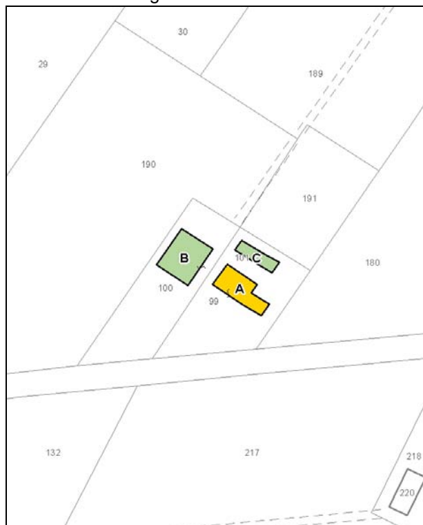
Catasto attuale – Scala 1: 2.000