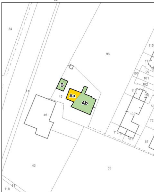
Catasto attuale – Scala 1: 2.000