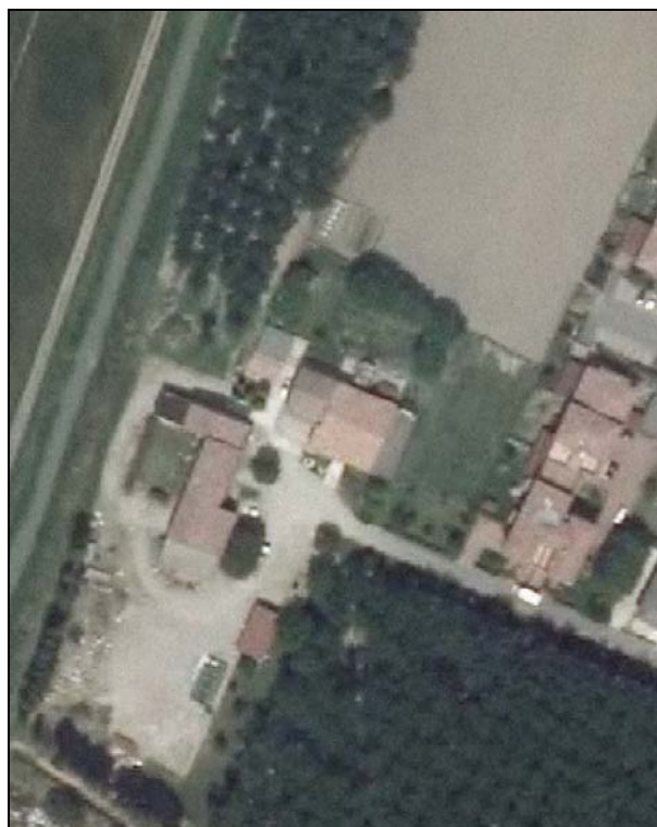
Ortofoto AIMA 2011 – Scala 1:2.000