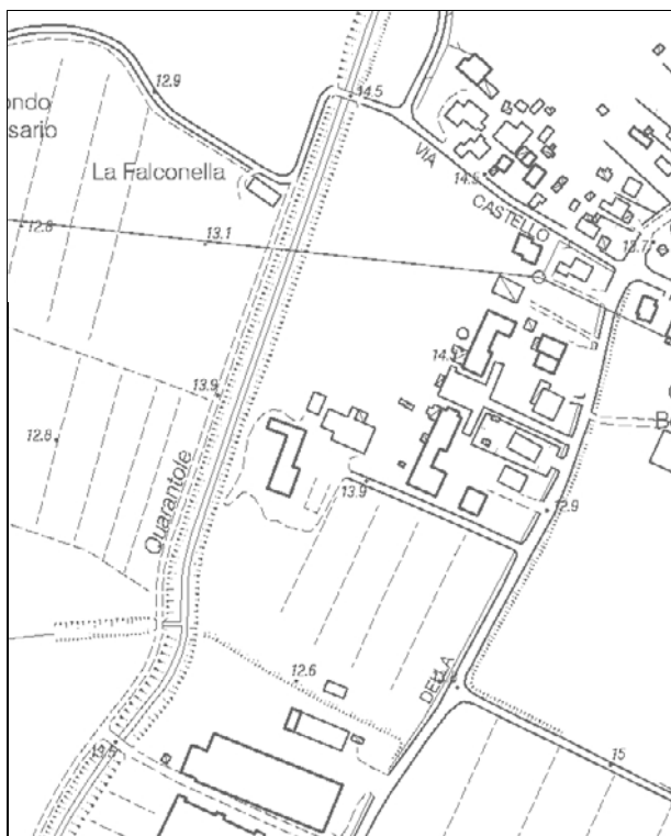
Carta Tecnica Regionale – Scala 1:5.000