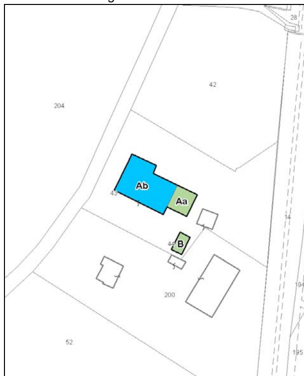
Catasto attuale – Scala 1: 2.000