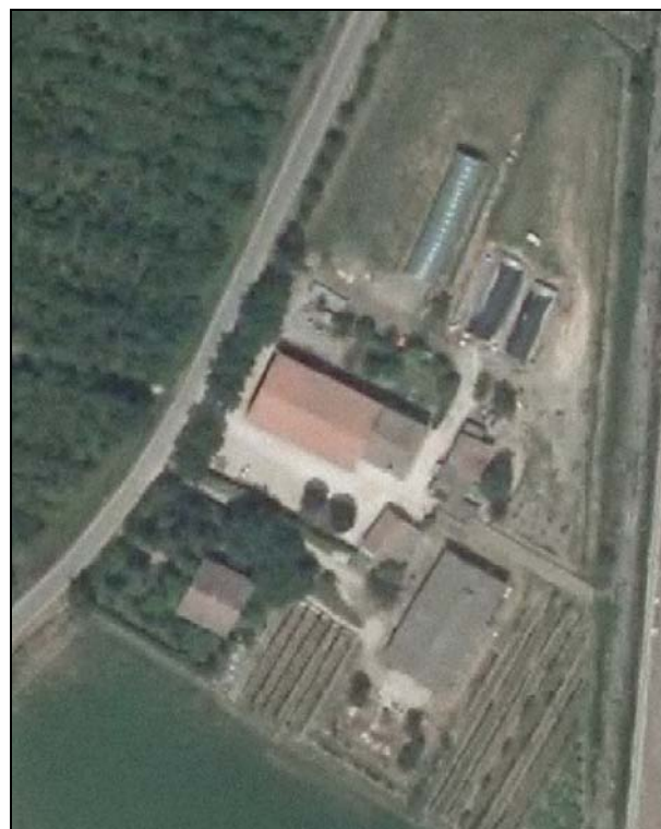
Ortofoto AIMA 2011 – Scala 1:2.000