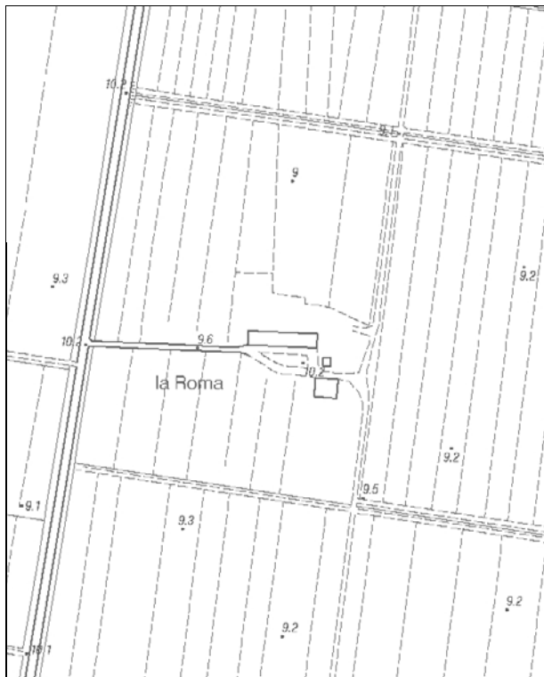
Carta Tecnica Regionale – Scala 1:5.000

Dati catastali: Foglio 102; Particella 27