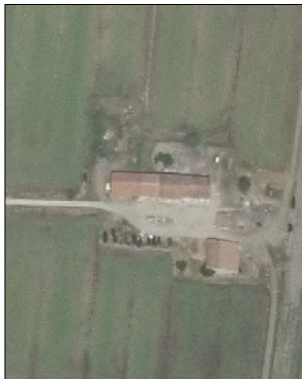
Ortofoto AIMA 2011 – Scala 1:2.000