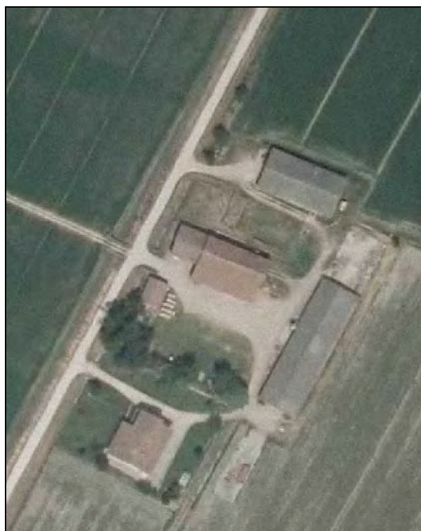
Ortofoto AIMA 2011 – Scala 1:2.000