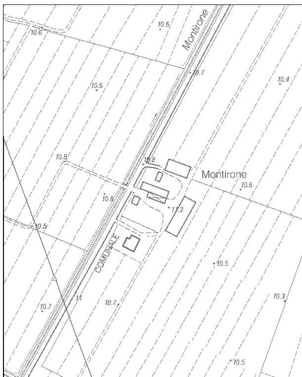
Carta Tecnica Regionale – Scala 1:5.000

Dati catastali: Foglio 148; Particelle 7, 48, 49