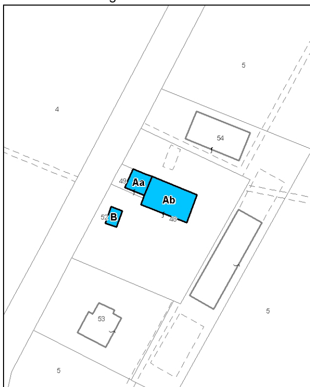
Catasto attuale – Scala 1: 2.000

Presenza di edifici con schede Aedes E: si