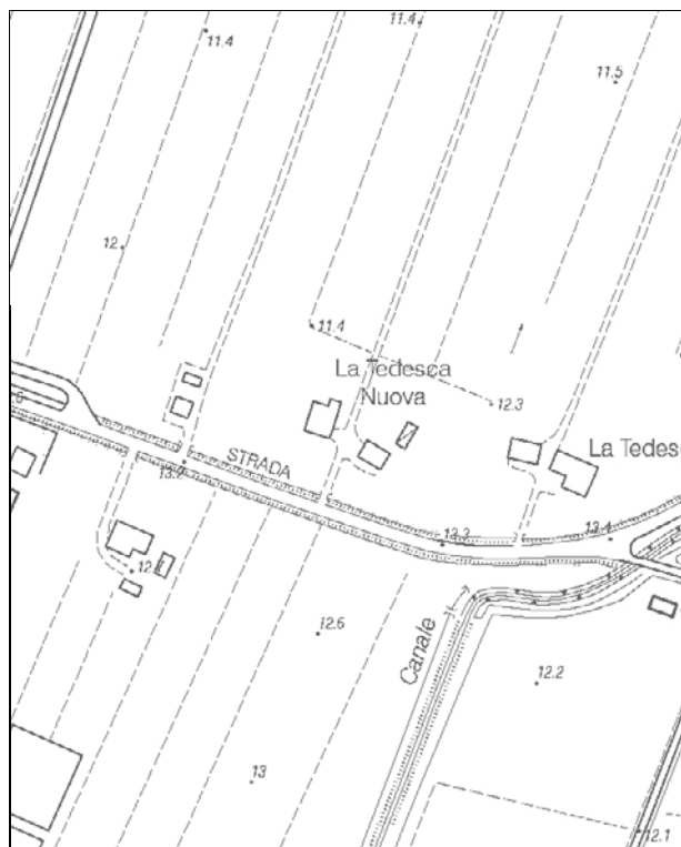
Carta Tecnica Regionale – Scala 1:5.000