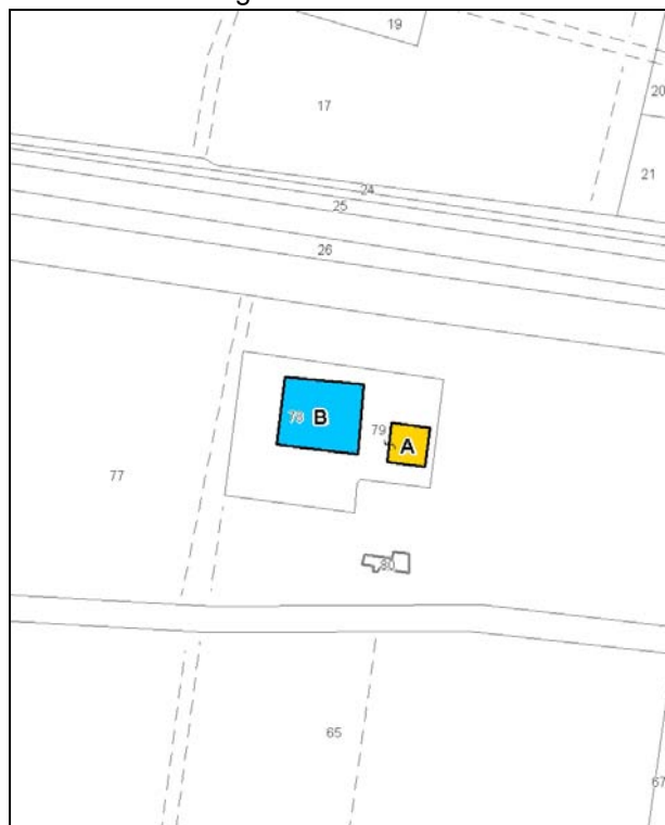
Catasto attuale – Scala 1: 2.000

Dati catastali: Foglio 60; Particelle 78, 79