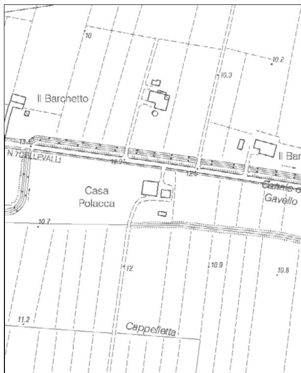
Carta Tecnica Regionale – Scala 1:5.000