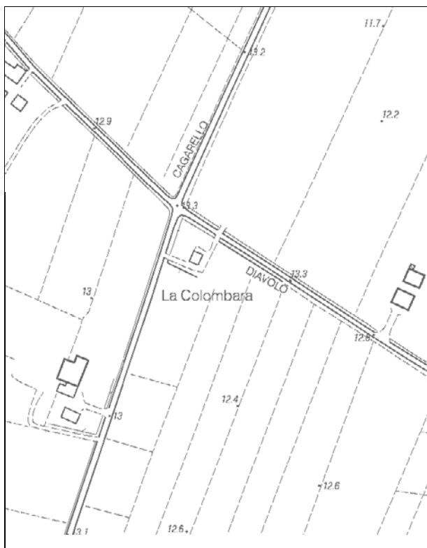
Carta Tecnica Regionale – Scala 1:5.000