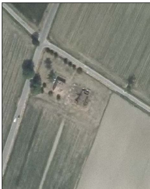
Ortofoto AIMA 2011 – Scala 1:2.000