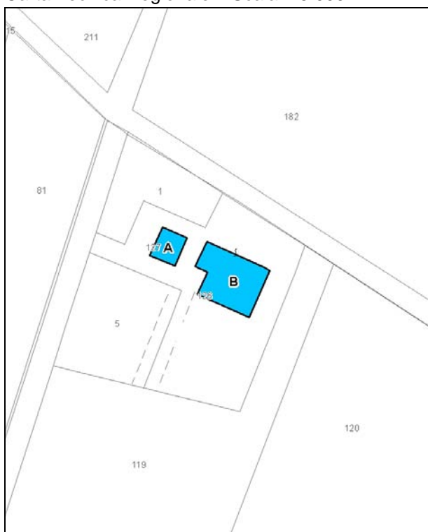
Catasto attuale – Scala 1: 2.000