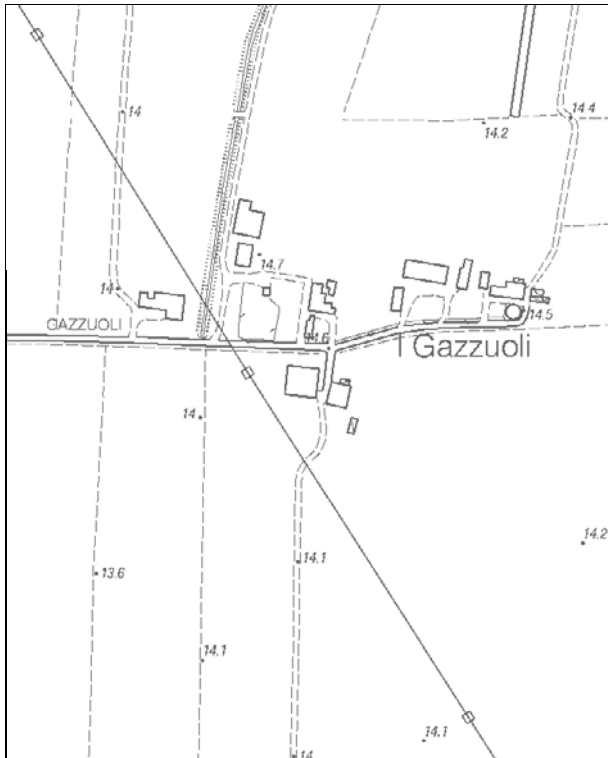
Carta Tecnica Regionale – Scala 1:5.000