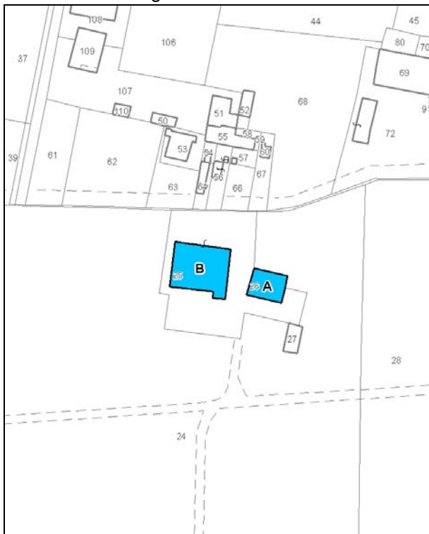
Catasto attuale – Scala 1: 2.000

Dati catastali: Foglio 94; Particelle 25, 26