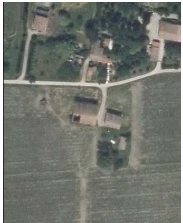
Ortofoto AIMA 2011 – Scala 1:2.000

Presenza di edifici con schede Aedes E: si