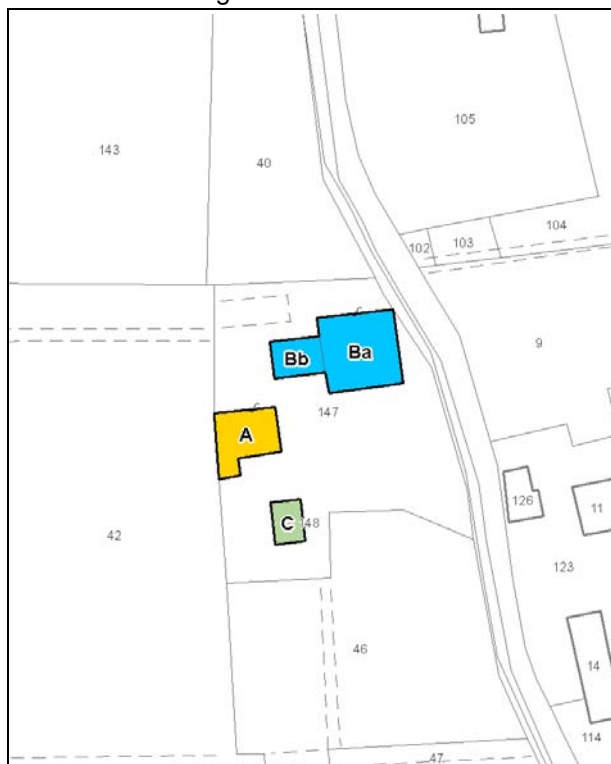
Catasto attuale – Scala 1: 2.000

Dati catastali: Foglio 136; Particelle 147, 148