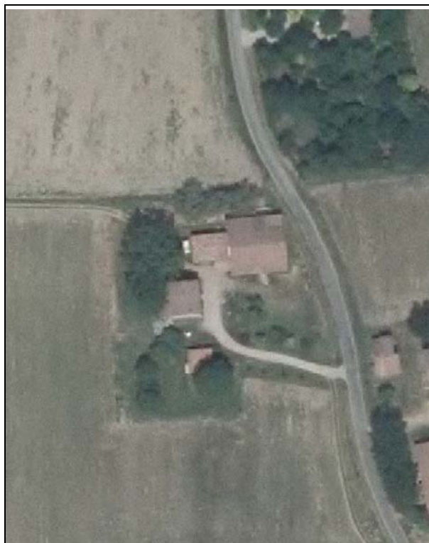
Ortofoto AIMA 2011 – Scala 1:2.000

Presenza di edifici con schede Aedes E: si