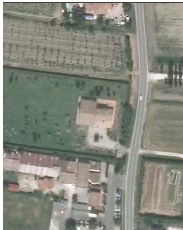
Ortofoto AIMA 2011 – Scala 1:2.000

Presenza di edifici con schede Aedes E: no