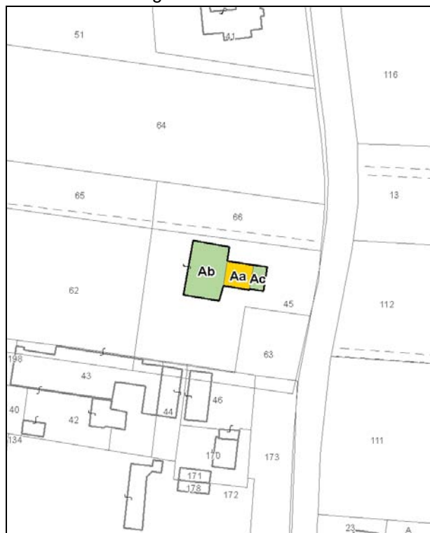
Catasto attuale – Scala 1: 2.000

Dati catastali: Foglio 69; Particelle 45, 63