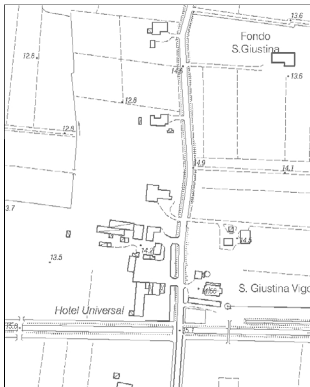
Carta Tecnica Regionale – Scala 1:5.000