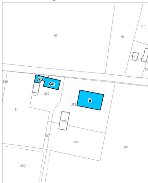
Catasto attuale – Scala 1: 2.000