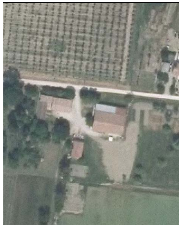
Ortofoto AIMA 2011 – Scala 1:2.000