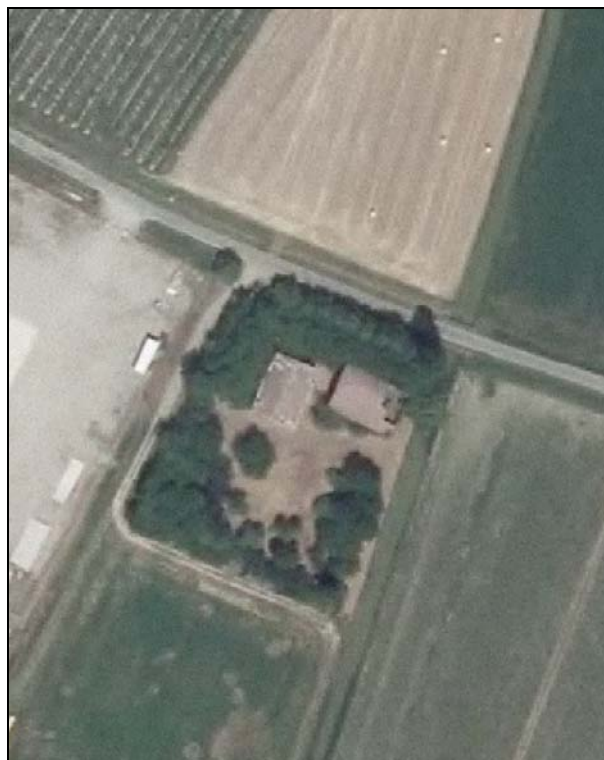
Ortofoto AIMA 2011 – Scala 1:2.000

Presenza di edifici con schede Aedes E: si