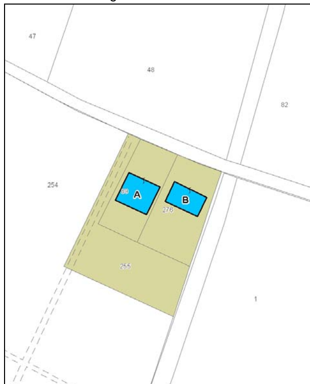
Catasto attuale – Scala 1: 2.000

Dati catastali: Foglio 129; Particelle 89, 255, 276