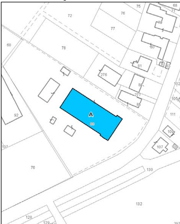
Catasto attuale – Scala 1: 2.000

Dati catastali: Foglio 40; Particella 88