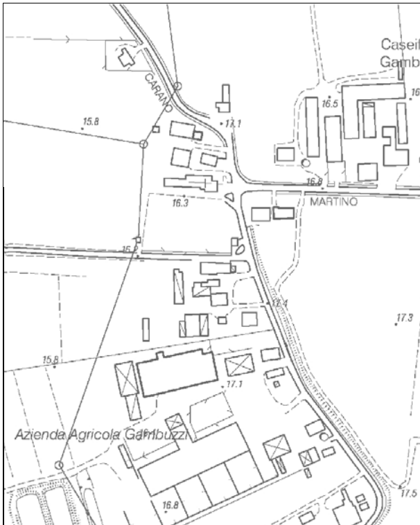
Carta Tecnica Regionale – Scala 1:5.000