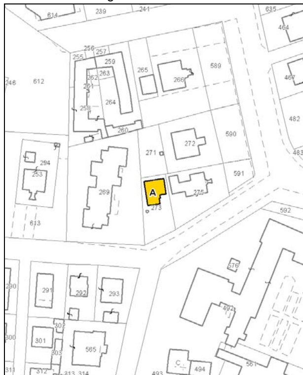
Catasto attuale – Scala 1:2.000

Dati catastali: Foglio 110 Particella 273