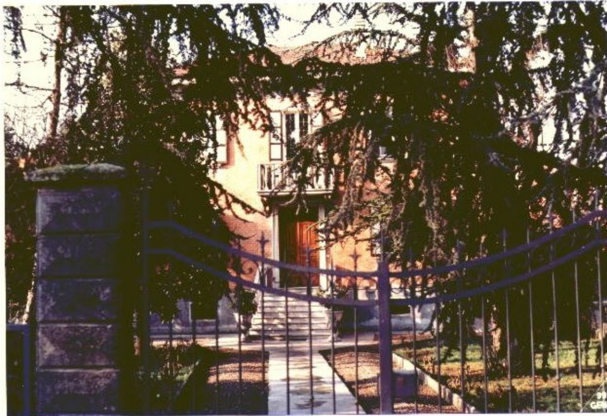
8 Categoria di intervento A2B