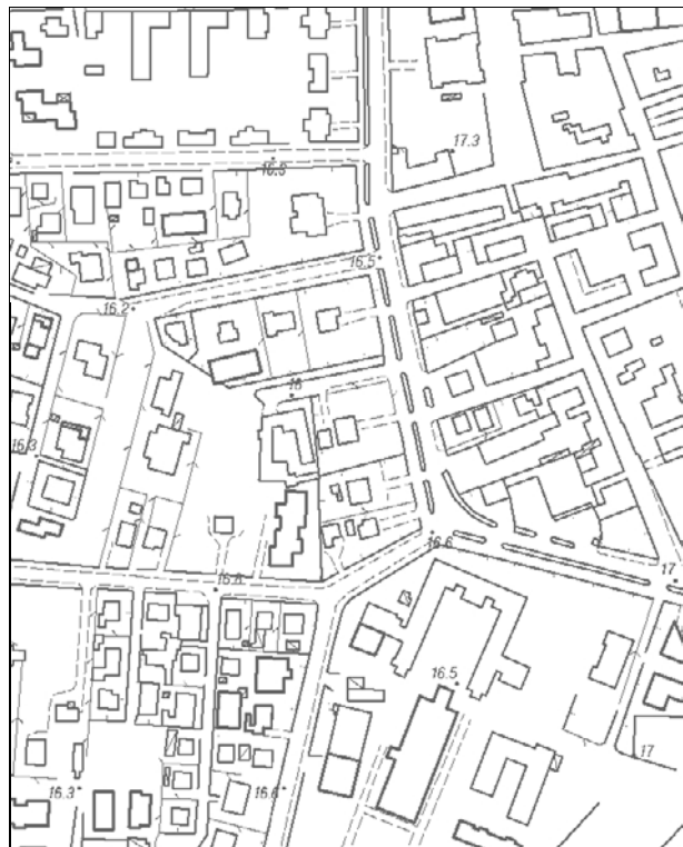
Carta Tecnica Regionale – Scala 1:5.000