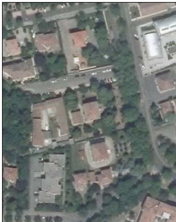
Ortofoto AIMA 2011 – Scala 1:2.000

Presenza di edifici con schede Aedes E: si