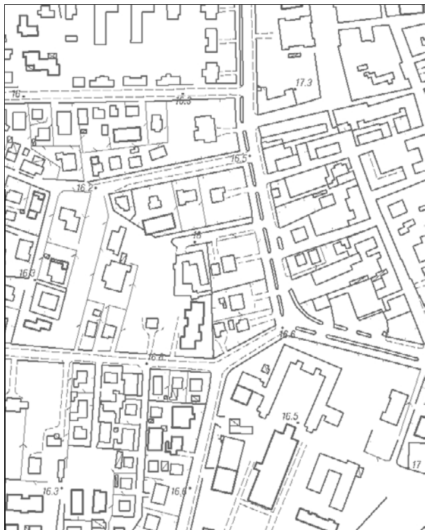
Carta Tecnica Regionale – Scala 1:5.000