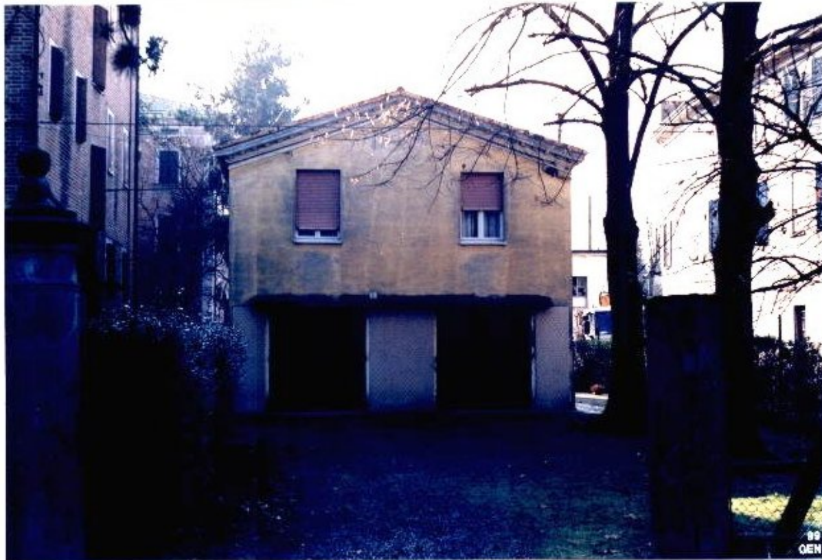
11 Categoria di intervento A3