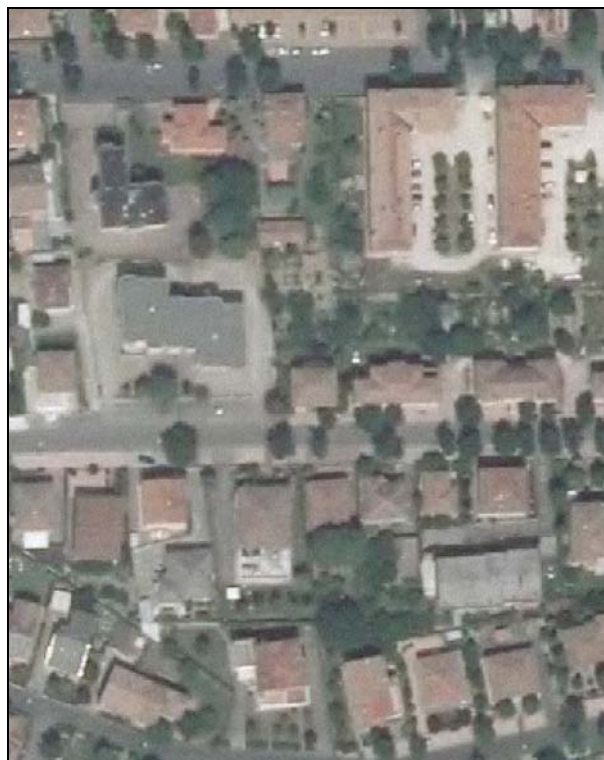
Ortofoto AIMA 2011 – Scala 1:2.000