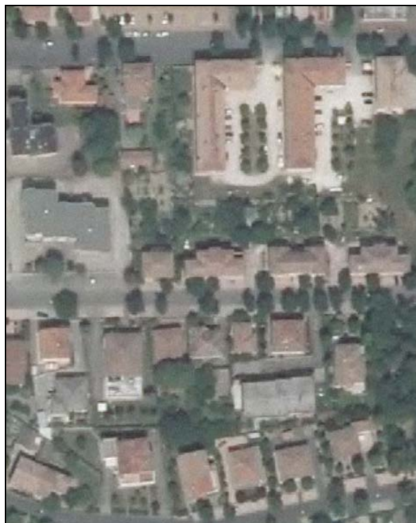
Ortofoto AIMA 2011 – Scala 1:2.000

Presenza di edifici con schede Aedes E: si