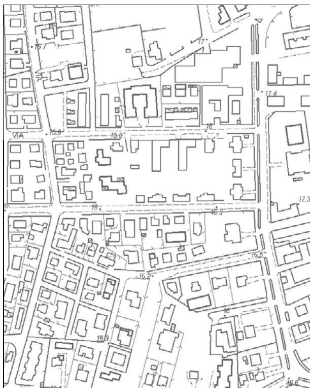
Carta Tecnica Regionale – Scala 1:5.000