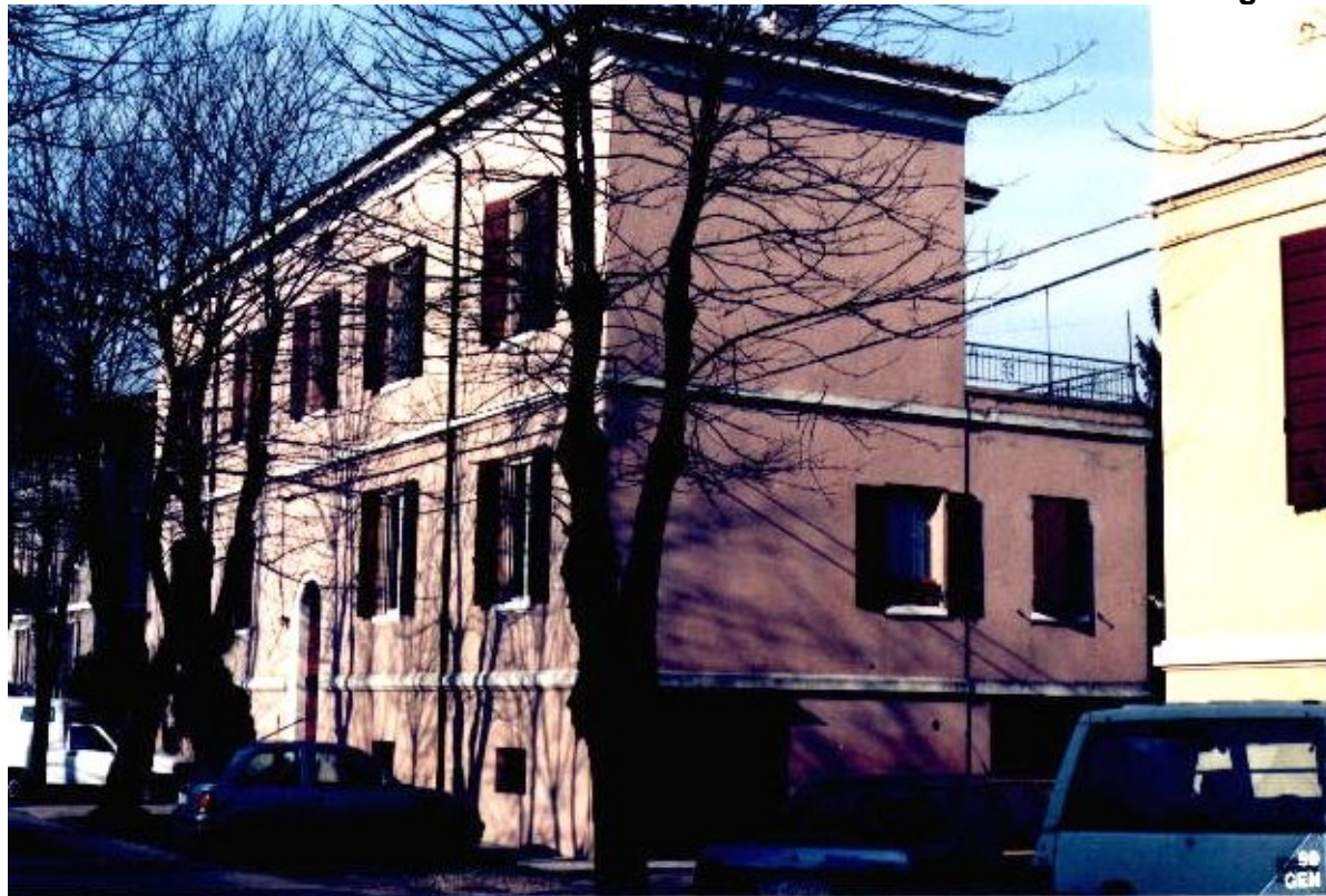
15 Categoria di intervento A2B