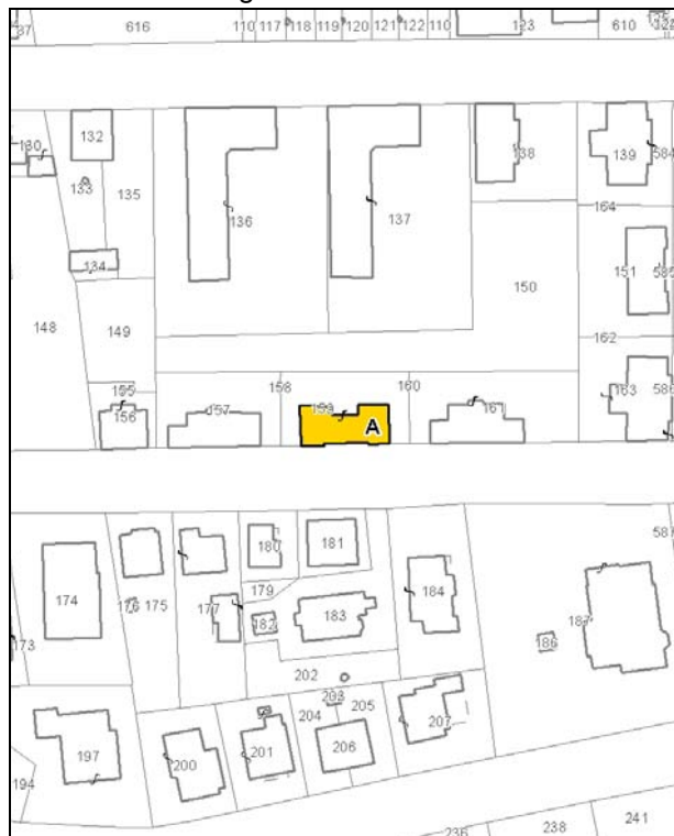
Catasto attuale – Scala 1: 2.000