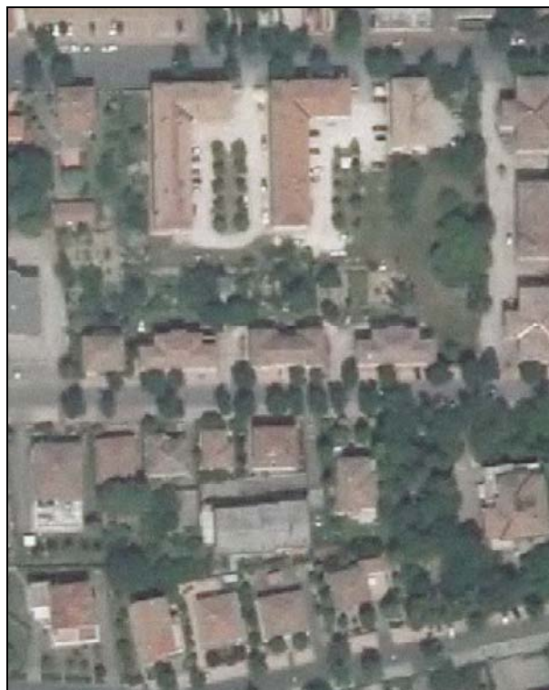
Ortofoto AIMA 2011 – Scala 1:2.000