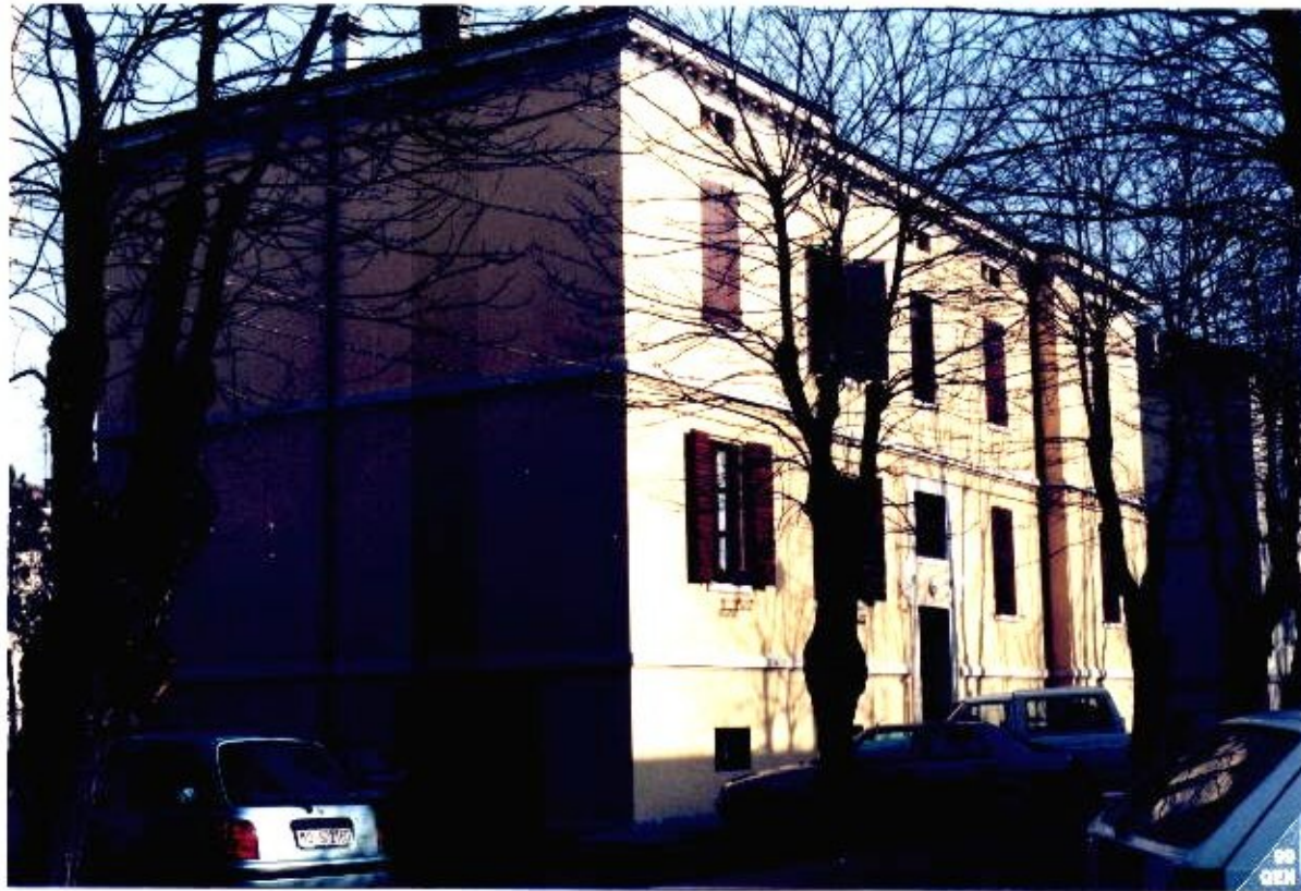
16 Categoria di intervento A2B