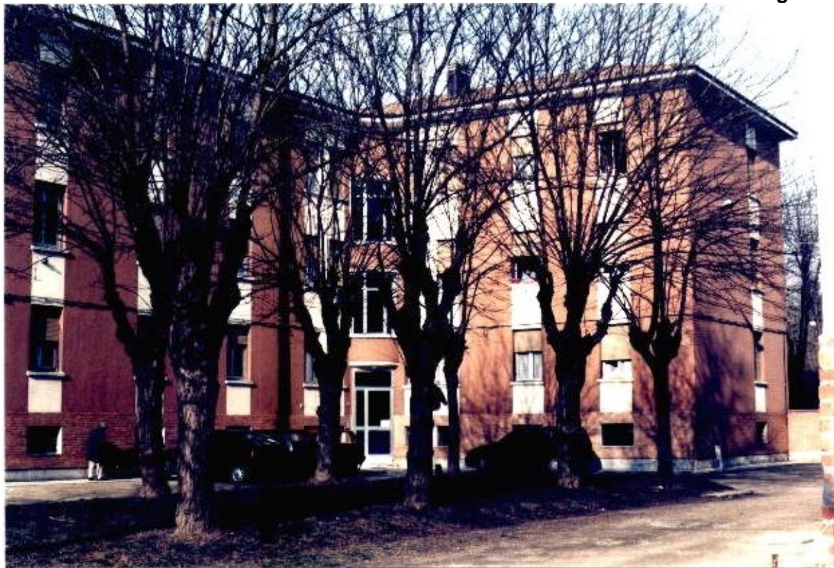
21 Categoria di intervento A2B