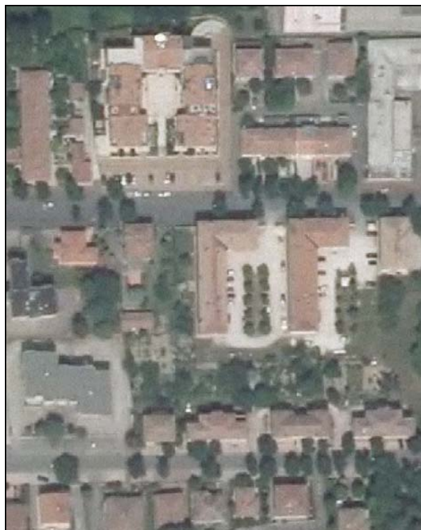
Ortofoto AIMA 2011 – Scala 1:2.000