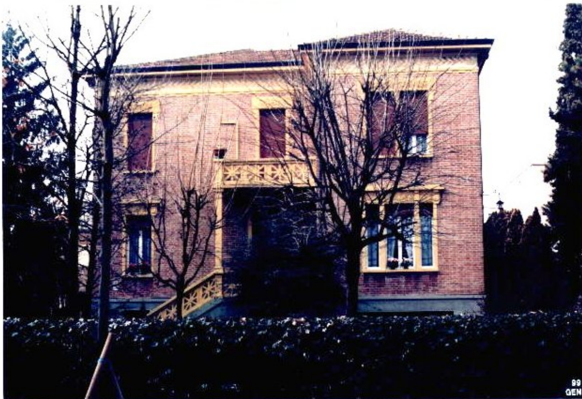
26 Categoria di intervento A2B