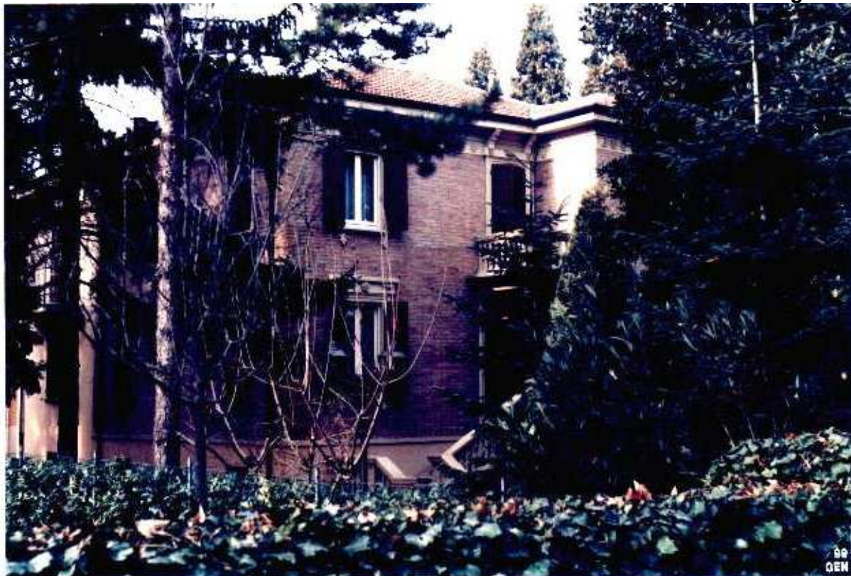
27 Categoria di intervento A2A