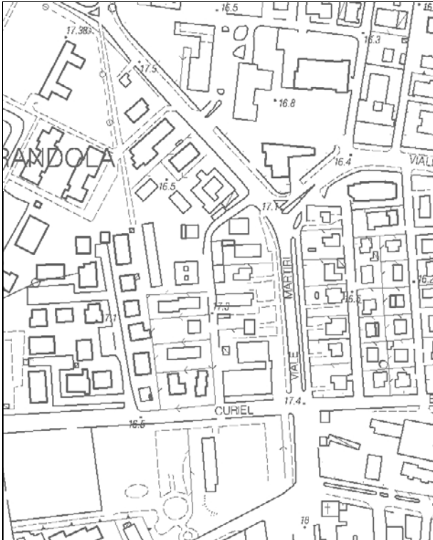
Carta Tecnica Regionale – Scala 1:5.000