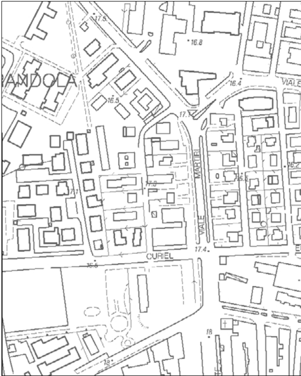
Carta Tecnica Regionale – Scala 1:5.000