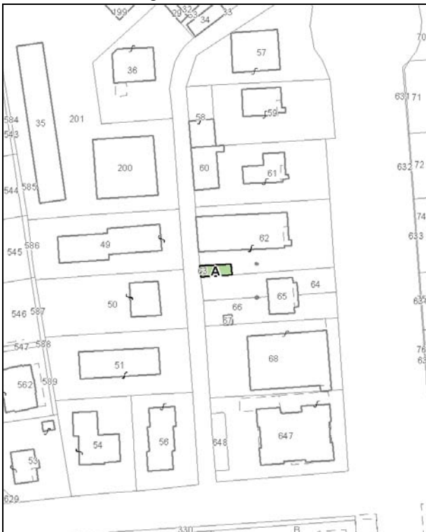
Catasto attuale – Scala 1: 2.000

Dati catastali: Foglio 109 Particella 63