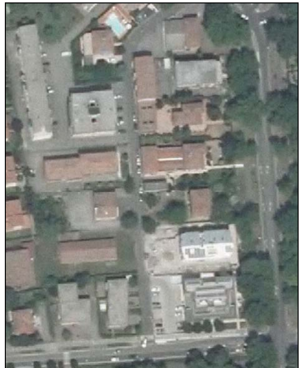
Ortofoto AIMA 2011 – Scala 1:2.000

Presenza di edifici con schede Aedes E: no