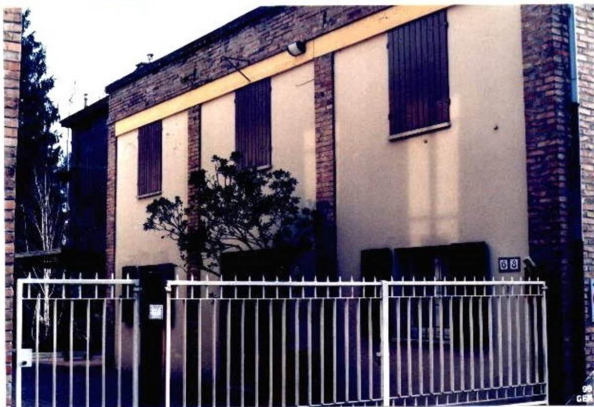
29 Categoria di intervento A2B