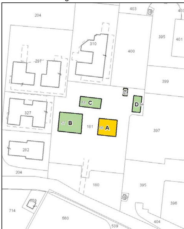
Catasto attuale – Scala 1:2.000