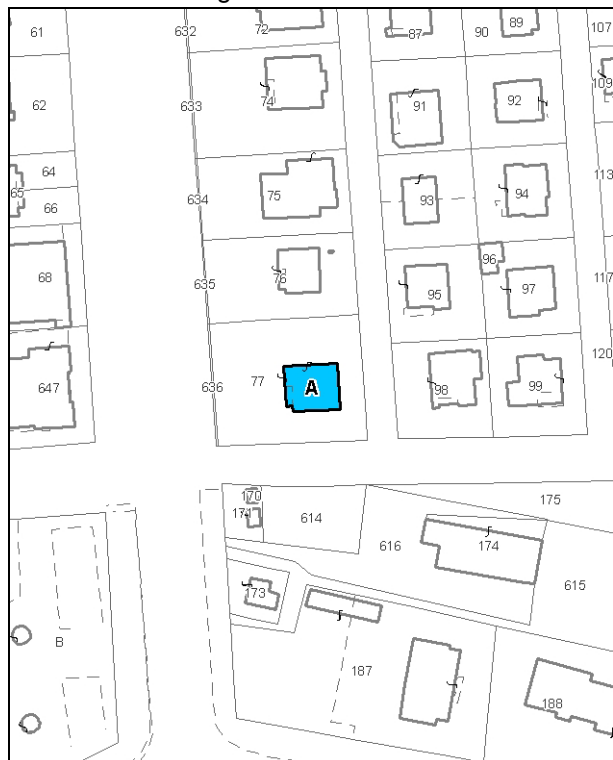
Catasto attuale – Scala 1: 2.000