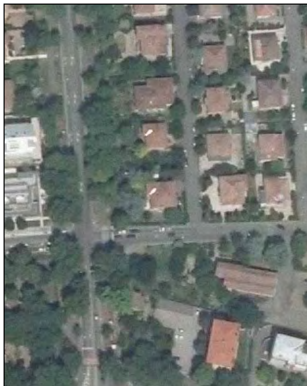
Ortofoto AIMA 2011 – Scala 1:2.000