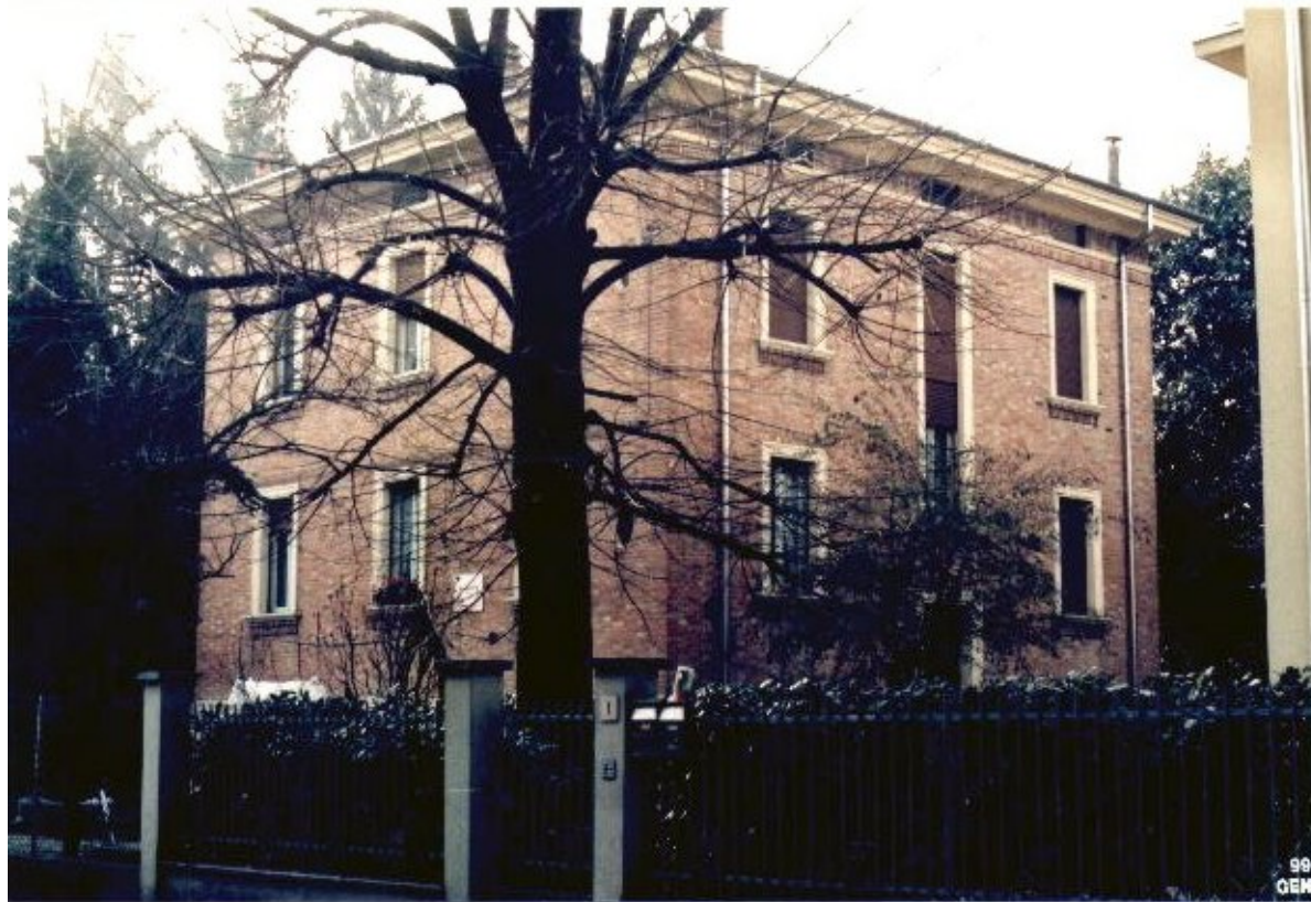
36 Categoria di intervento A2B