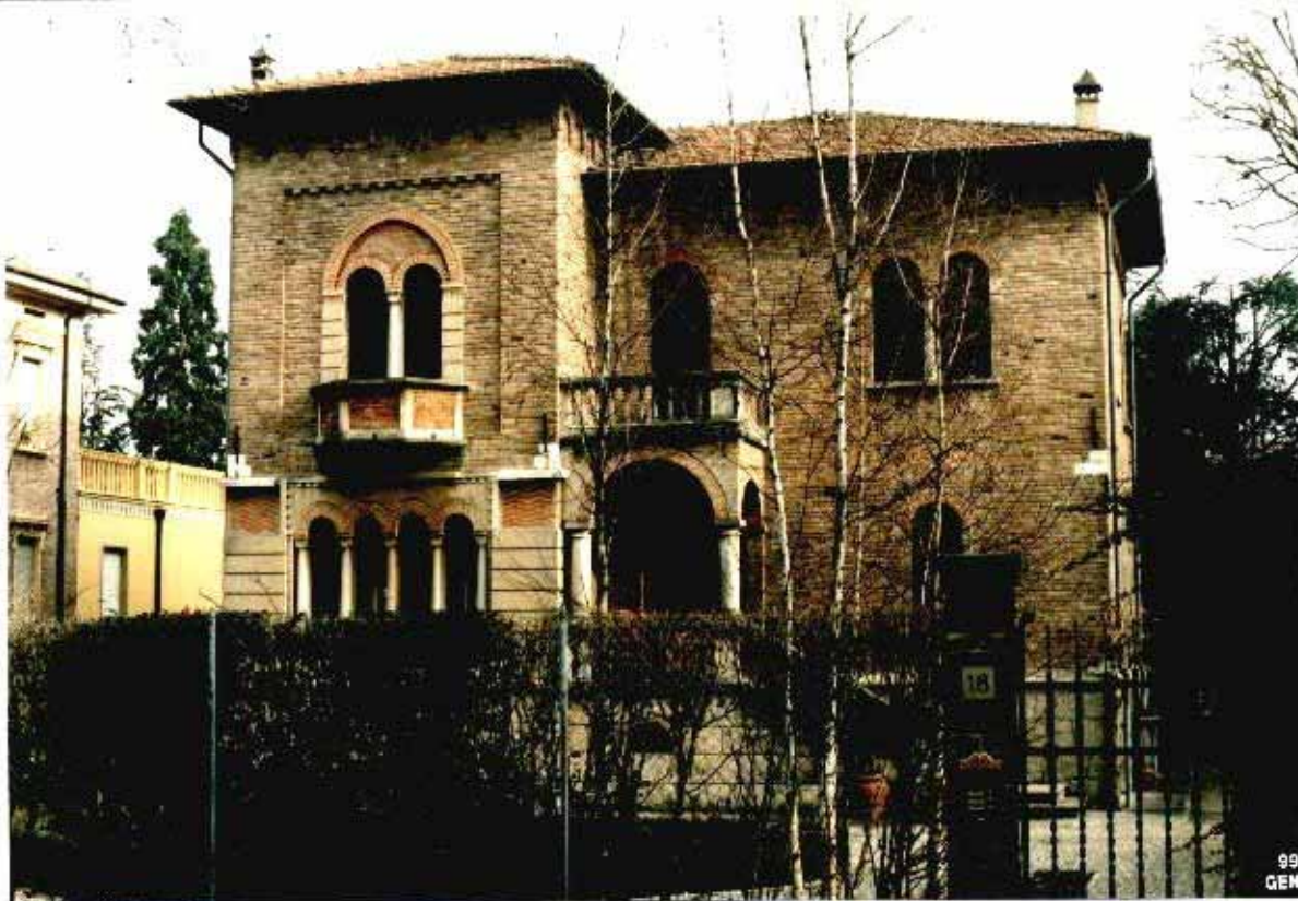
38 Categoria di intervento A2A