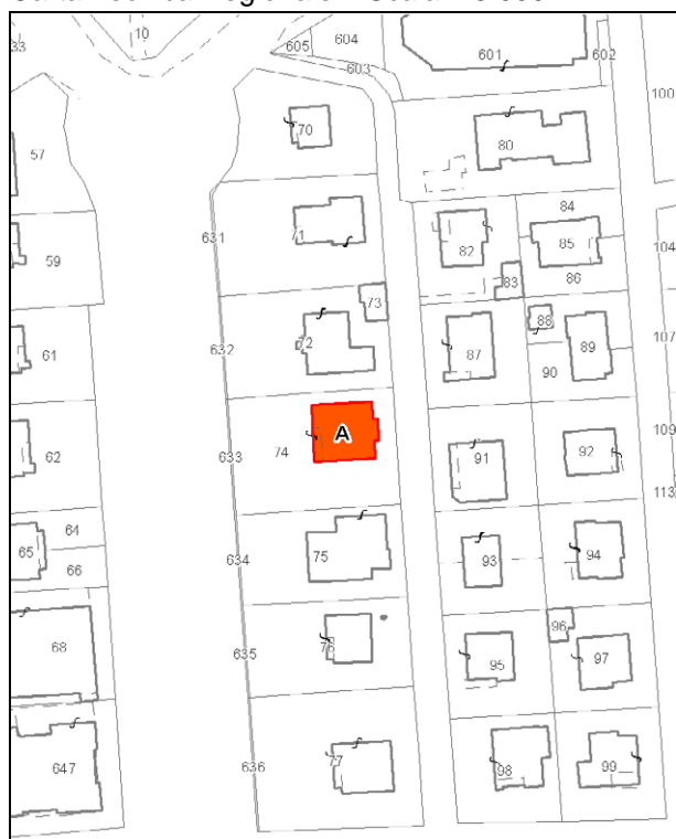
Catasto attuale – Scala 1: 2.000