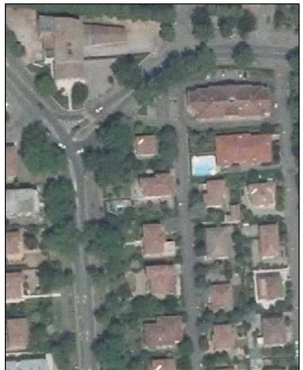
Ortofoto AIMA 2011 – Scala 1:2.000