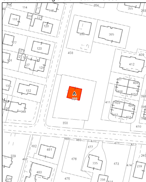
Catasto attuale – Scala 1:2.000