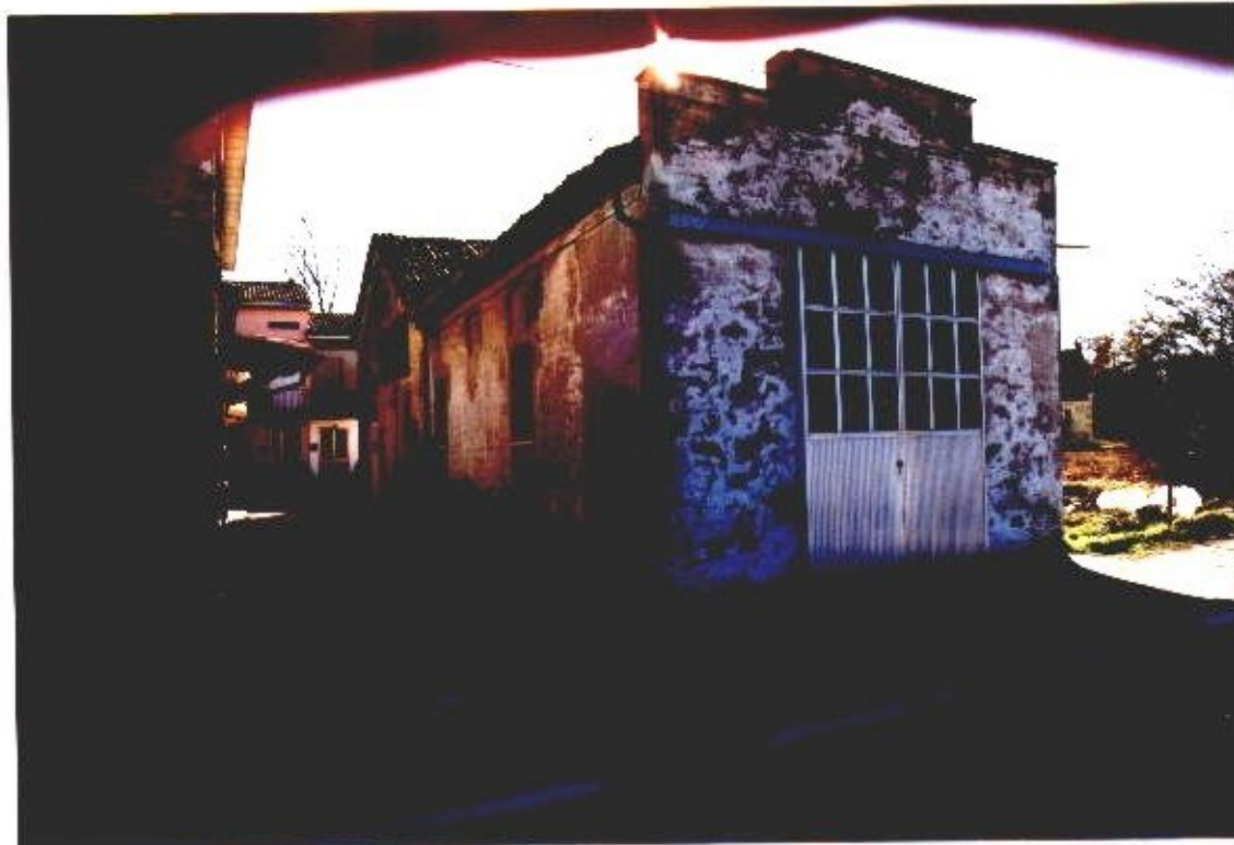
47 Categoria di intervento A3