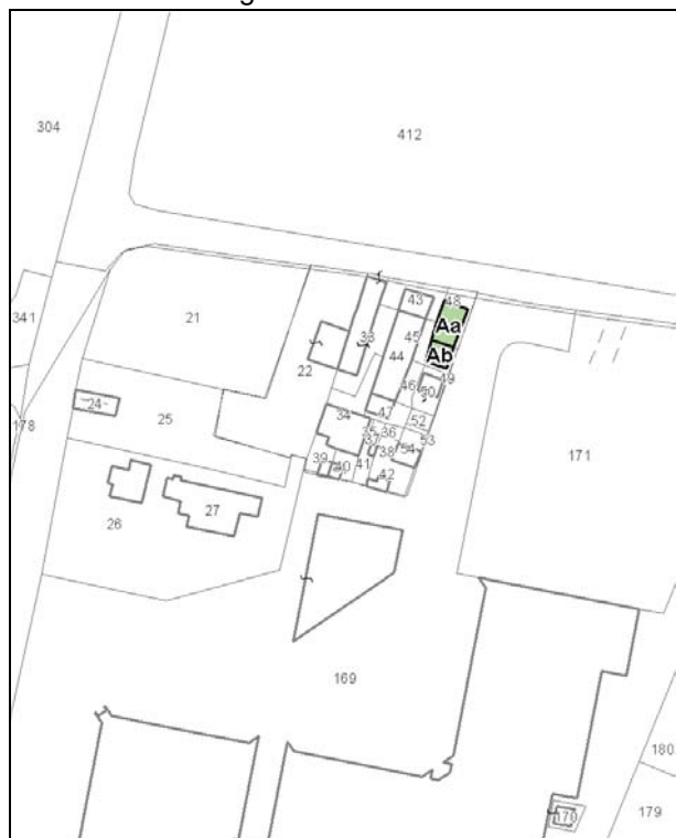
Catasto attuale – Scala 1:2.000

Presenza di edifici con schede Aedes E: no