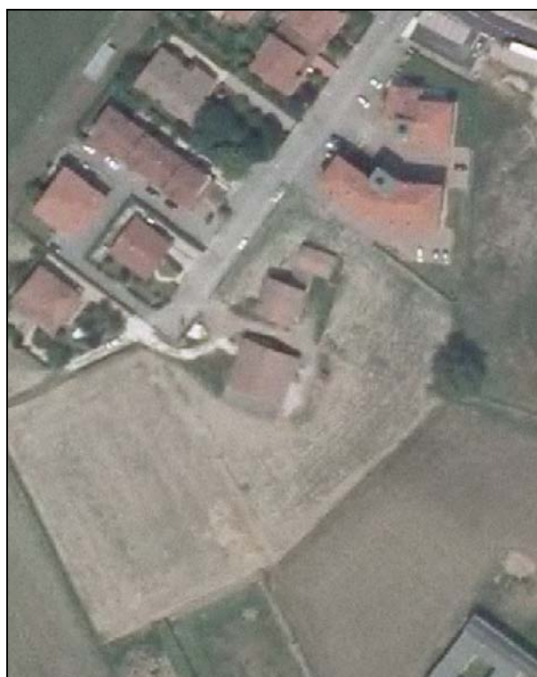
Ortofoto AIMA 2011 – Scala 1:2.000