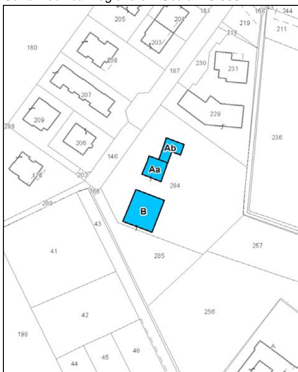
Catasto attuale – Scala 1: 2.000