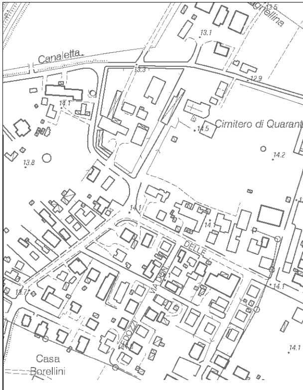
Carta Tecnica Regionale – Scala 1:5.000