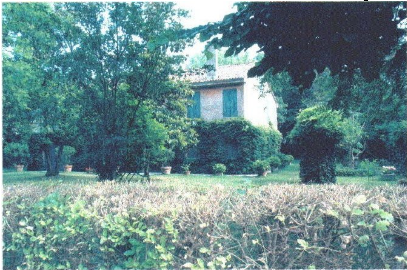
54 Categoria di intervento A3