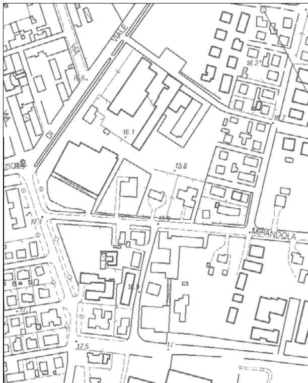
Carta Tecnica Regionale – Scala 1:5.000

Dati catastali: Foglio 112 Particella 90