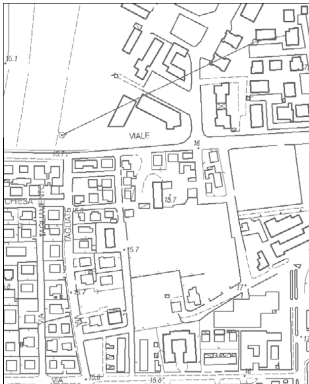
Carta Tecnica Regionale – Scala 1:5.000