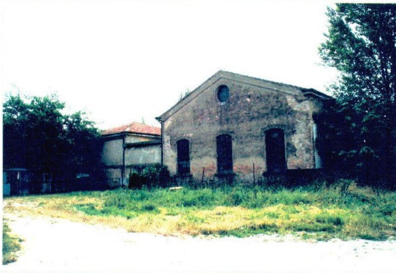
57 Categoria di intervento A2b