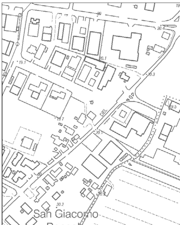
Carta Tecnica Regionale – Scala 1:5.000

Dati catastali: Foglio 152 Particella 78