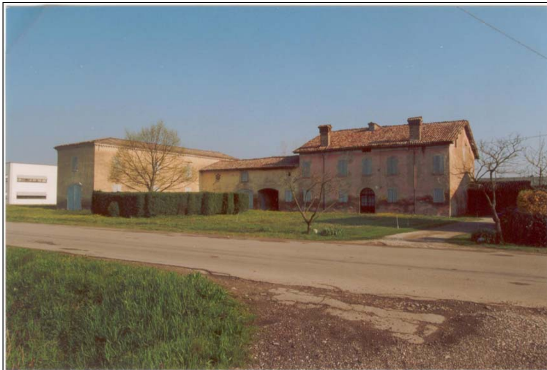
62 Categoria di intervento A2B