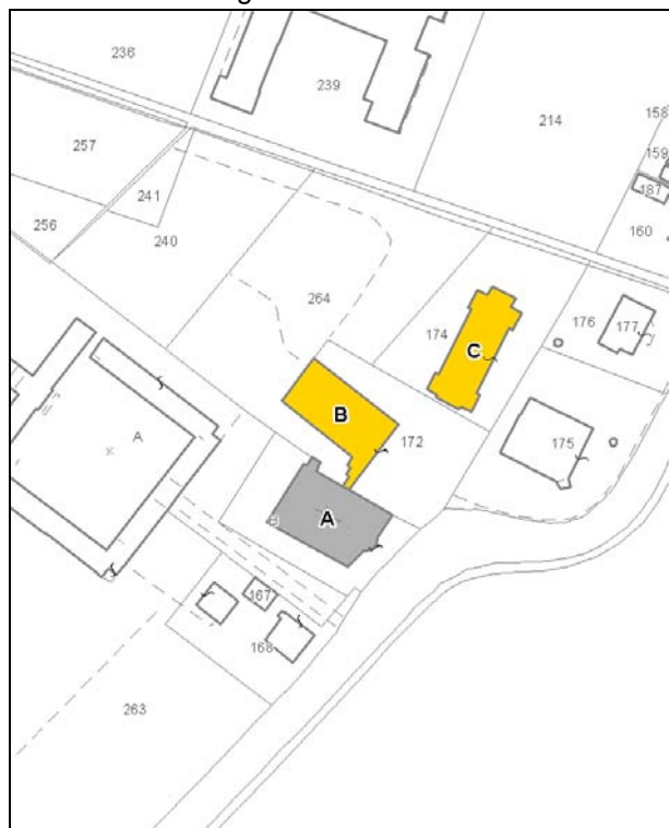
Catasto attuale – Scala 1: 2.000

Dati catastali: Foglio 143 Particelle B, 172, 174