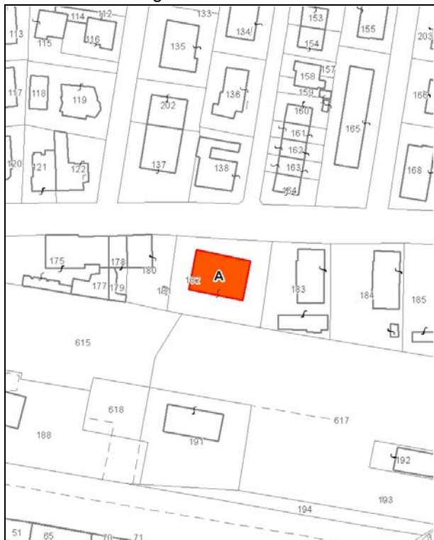
Catasto attuale – Scala 1:2.000

Dati catastali: Foglio 109 Particelle 182