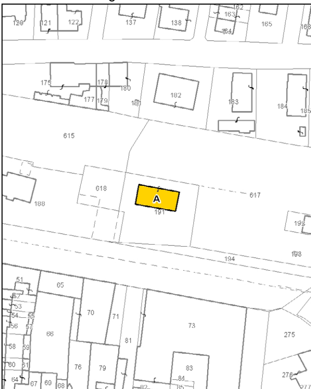
Catasto attuale – Scala 1: 2.000

Dati catastali: Foglio 109 Particella 191