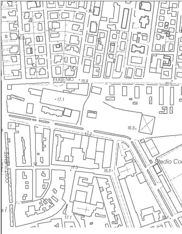
Carta Tecnica Regionale – Scala 1:5.000